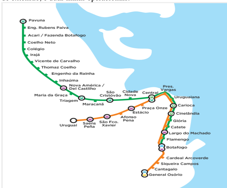
Figura 1 – Mapa do Metro do Rio de Janeiro

Em 2007, mais uma mudança envolvendo o bairro de Copacabana, com a inauguração da nova estação terminal: Cantagalo e no final de 2009, duas importantes mudanças ocorreram: a inauguração da estação General Osório, no bairro de Ipanema, passando a ser o novo terminal da linha 1, e a mudança na forma de operação do sistema com o fim da transferência entre as linhas 1 e 2 na estação Estácio. Até então, os usuários da linha 2 precisavam efetuar a transferência entre as linhas na estação Estácio; a partir de dezembro de 2009, os trens da linha 2 passaram a compartilhar os trilhos com os trens da linha 1, no trecho compreendido entre as estações de Central e Botafogo, que passou a ser uma estação terminal da Linha 2. Em 2012, o MetrôRio contava com 36 estações e cerca de 41 km de extensão, e duas linhas operacionais.